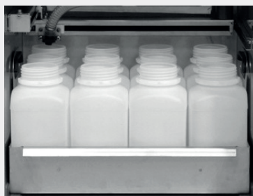
12 x 2,9 l PE lub 2 l szkło