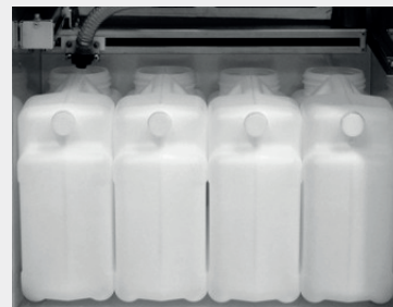
4 x 12 l PE