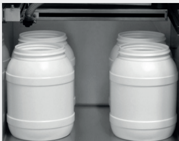
4 x 6,4 l PE