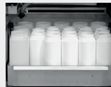
7 x 2 l PE + 14 x 1 l PE

Inne konfiguracje dostępne na zapytanie; możliwe wykorzystanie naczyń niestandardowych (użytkownika).