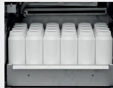
24 x 1 l PE lub 0,9 l szkło

Dla próbek godzinowych lub podobnych, z dodatkowym pojemnikiem na próbę łącznie: