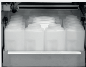
12 x 2 l PE + 1 x 6,4 l PE

Dla próbek godzinowych lub podobnych, z dodatkowym pojemnikiem na próbę łącznie: