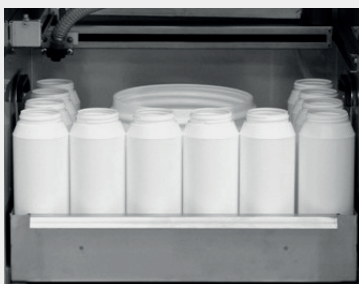
12 x 1 l PE + 1 x 10,4 l PE