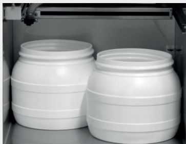
2 x 10,4 l PE

Dla wielu próbek dobowych, np. z weekendu: